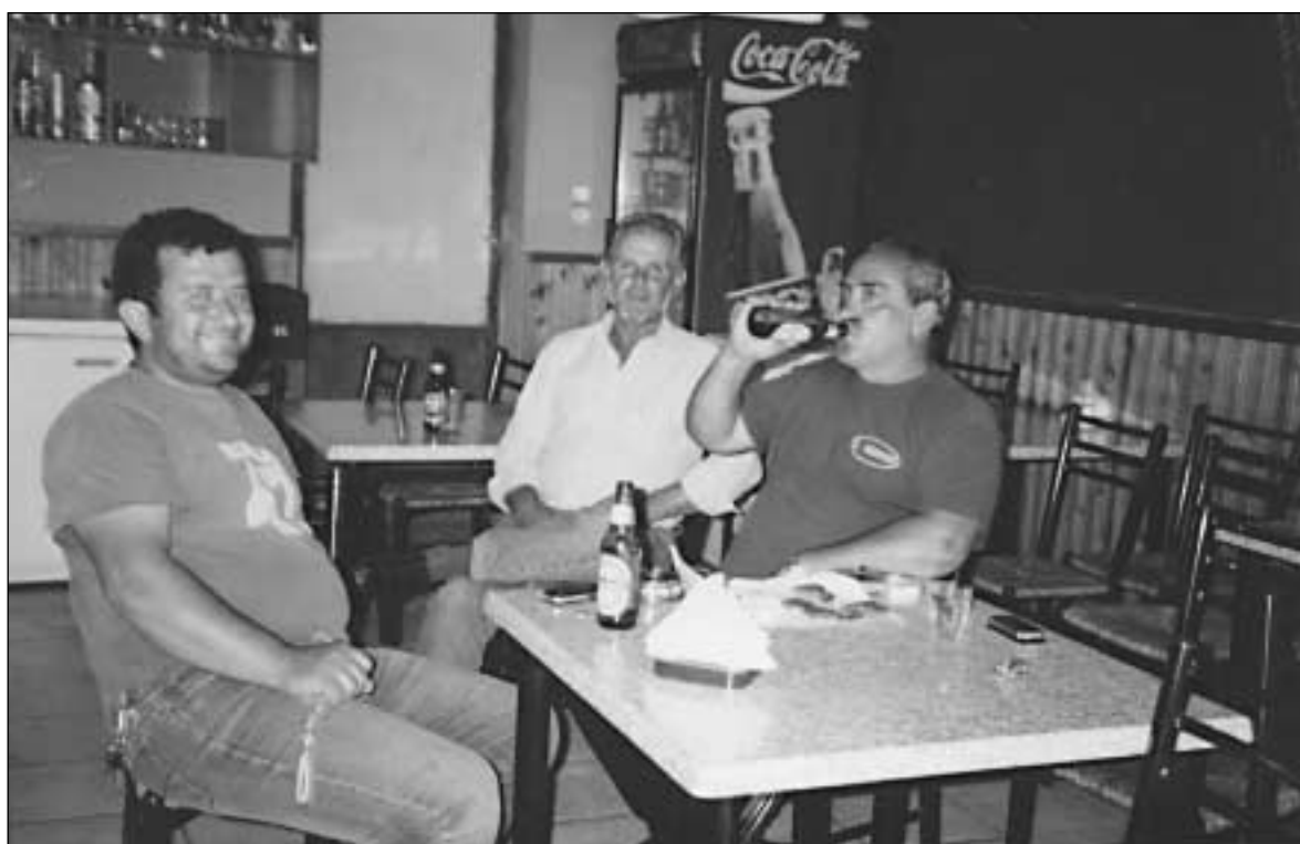
Μετά από ώριμη σκέψη!!!