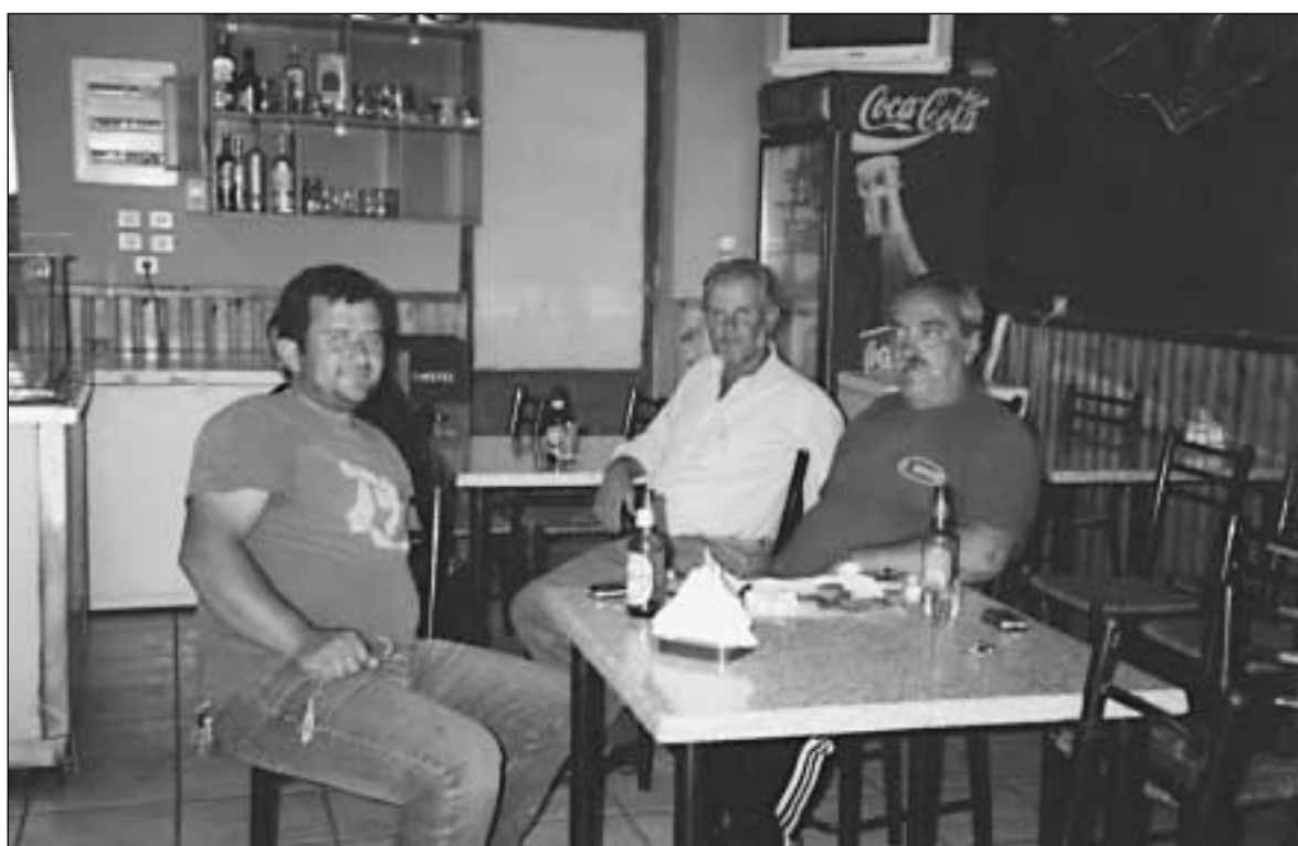
Περισυλλογή και σκέψη...

– Σήμερα έχουμε Θρησκευτικά για τ' μιλιτζάνα!!!