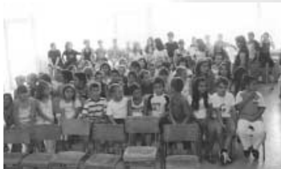
Μαθητές του Δημοτικού Σχολείου.