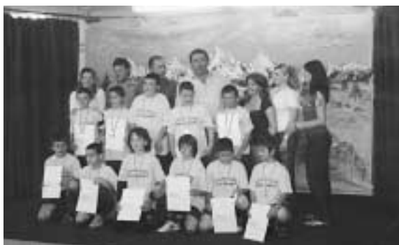
Δάσκαλοι και μαθητές - ποδοσφαιριστές. Όλοι τους άξιοι πρωταθλητές.